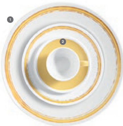
1 425038 Finca 2 328112 Country Colours Lemon