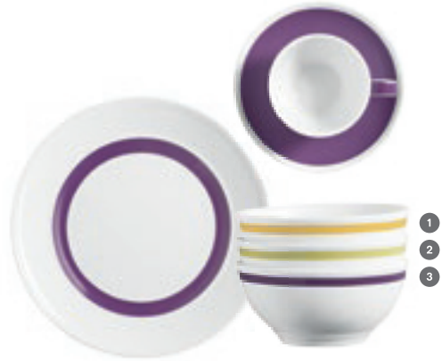
1 328112 Country Colours Lemon 2 328562 Country Colours Softgreen 3 328561 Country Colours Plum