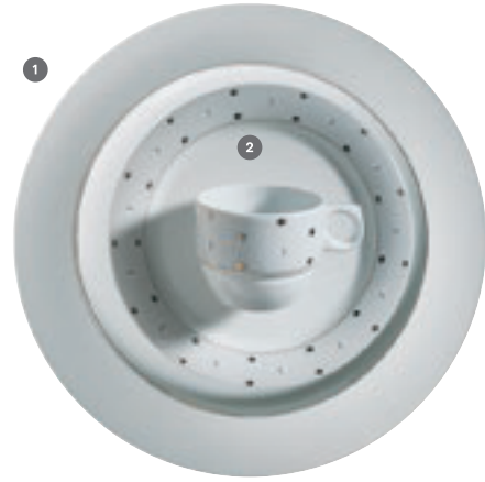
1 413430 La Perla Uni 2 413440 La Perla