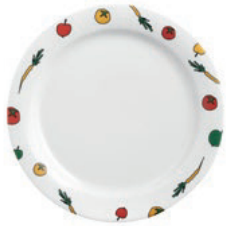
425002 Happy Veggies