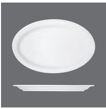
Platte oval Fahne , Platter oval with rim, Plat ovale avec aile, Fuente oval con ala, Piatto ovale