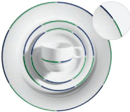
413410 Amano Blau 424430 Amano Blau II 424440 Amano Rot