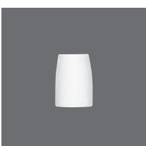
Leuchter Tülle 18 DIN 7409 , Candleholder, Bougeoir, Candelabro, Portacandela