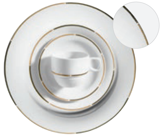
413420 Amano Grau 424450 Amano Grün 424460 Amano Gelb-Orange