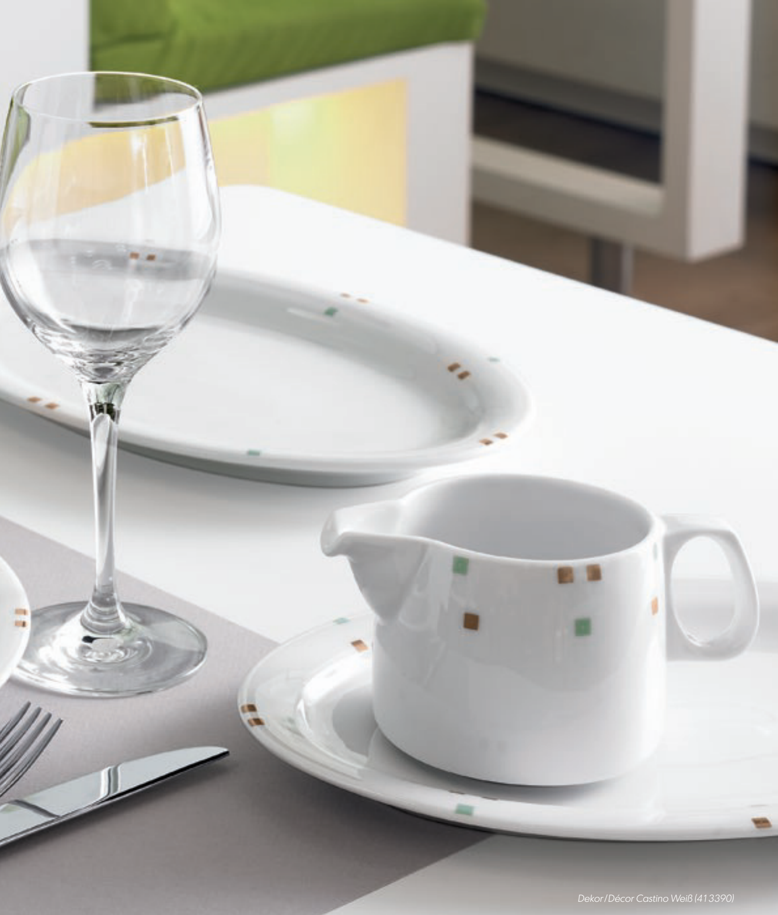
Dekor/Décor Castino Weiß (413390)

Wer sich unverwechselbar präsentieren möchte, entscheidet sich für unseren Dekor-Service. Wir entwickeln für Sie ein individuelles Dekor ganz nach Ihren Wünschen, passend zu der Innenausstattung der jeweiligen Lokalität.