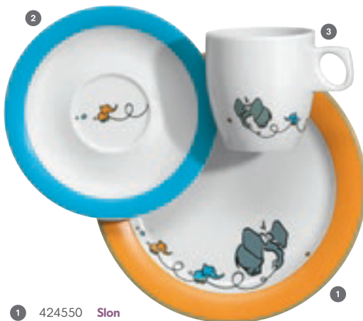
1 424550 Slon 2 424550 3 424550