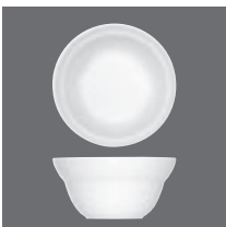
Schale , Bowl, Bol, Bowl, Coppetta