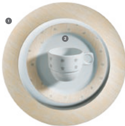
1 325500 Pintura Uni nicht auf Kannen und Tassen / except on pots and cups 2 413360 Pintura Karos