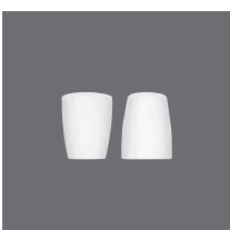
Salz-/Pfefferstreuer , Salt/Pepper shaker, Salière/Poivrière, Salero/Pimentero, Spargi sale/Spargi pepe