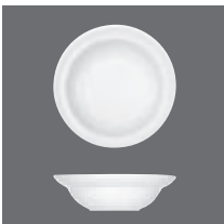
Schale , Bowl, Bol, Bowl, Coppetta