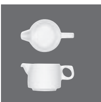
Sauciere , Sauce-boat, Saucière, Salsera, Salsiera