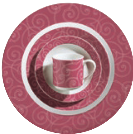
326210 Deauville Rot