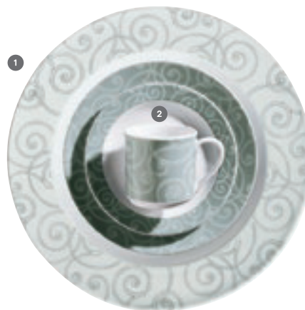
1 326220 Deauville Ornaments 2 326230 Deauville Grau