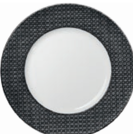
422090 Glimmer Quadrate