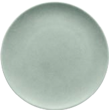
700410 Stone Gray