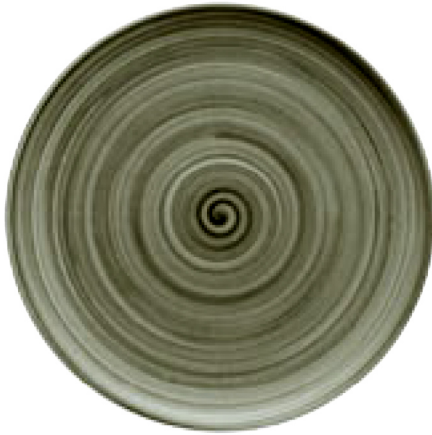
820300 Ceramica Wood

Nicht erhältlich auf Teller flach quadratisch (11 1519, 11 1529) und Platte rechteckig (11 2330) Not available on Plate flat square (11 1519, 11 1529) and Platter rectangular (11 2330)