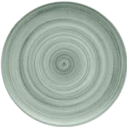
820299 Ceramica Gray