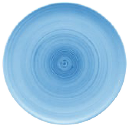
820302 Ceramica Blue