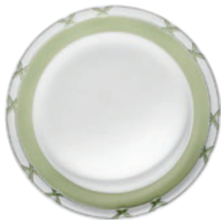
413760 Charlottenburg Seladon-Platin – Farbige Kreuze mit Fond Nur auf Tellern und Platten / Only on plates and platter