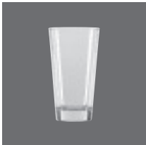
Latte Macchiato Glas , Latte macchiato glass, Verre à latte macchiato, Vaso para latte macchiato, Vetro per latte macchiato