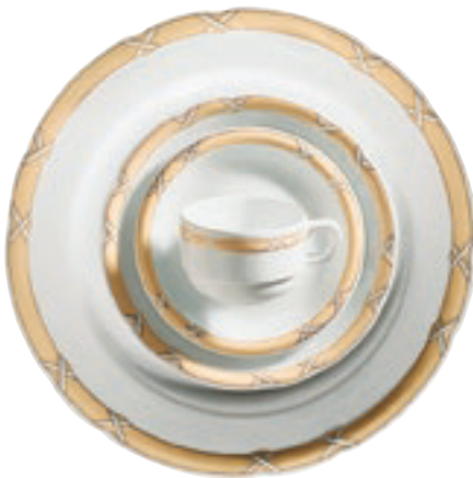
413720 Charlottenburg Gelb-Gold – Farbiges Band