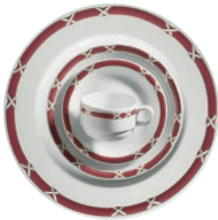
413780 Charlottenburg Rot-Gold – Farbiges Band