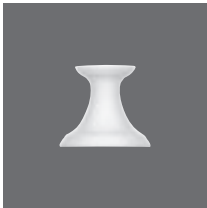
Leuchter Tülle 18 DIN 7409 , Candleholder, Bougeoir, Candelabro, Portacandela