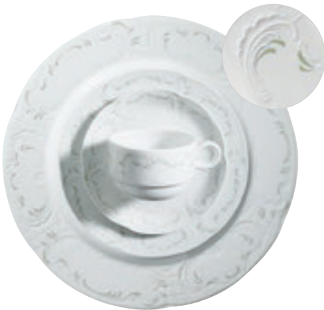
323770 Residenz Seladon