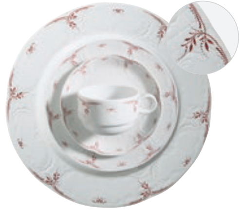
322540 Rote Zweige