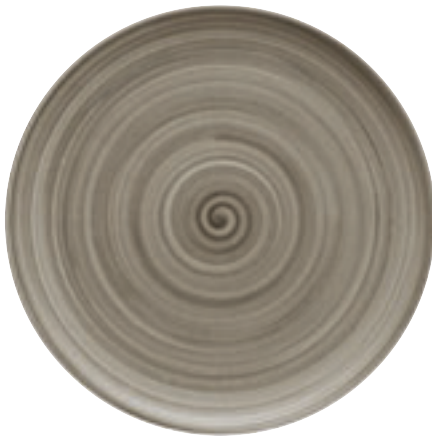
820300 Ceramica Wood

Nicht erhältlich auf Teller flach quadratisch (11 1519, 11 1529) und Platte rechteckig (11 2330) Not available on Plate flat square (11 1519, 11 1529) and Platter rectangular (11 2330)