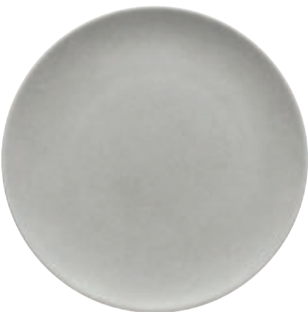
700410 Stone Gray