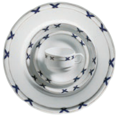
413800 Charlottenburg Blau-Gold – Farbige Kreuze