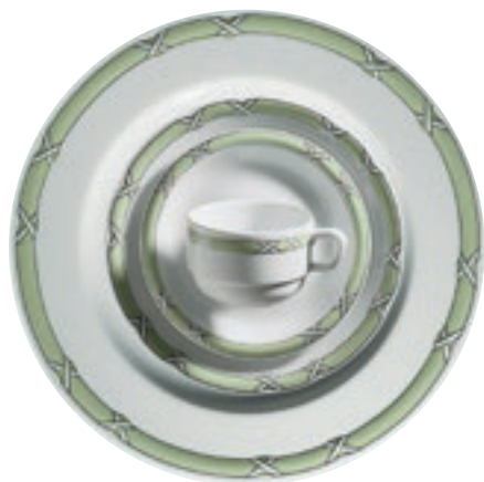
413750 Charlottenburg Seladon-Platin – Farbiges Band