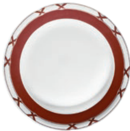
413790 Charlottenburg Rot-Gold – Farbige Kreuze mit Fond Nur auf Tellern und Platten / Only on plates and platter