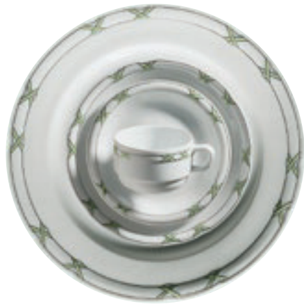
413740 Charlottenburg Seladon-Platin – Farbige Kreuze