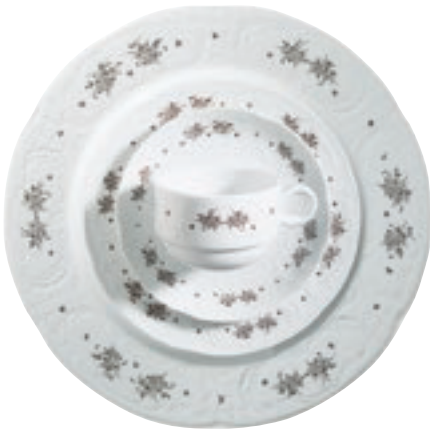
322240 Brauner Streuer