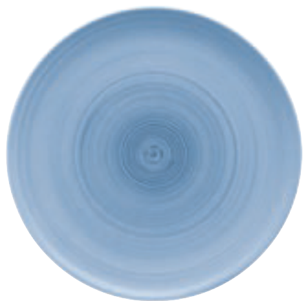
820302 Ceramica Blue