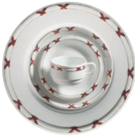
413770 Charlottenburg Rot-Gold – Farbige Kreuze