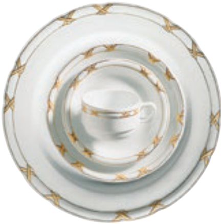
413710 Charlottenburg Gelb-Gold – Farbige Kreuze