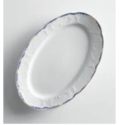
Dekor/Décor Zarensaal (410790)