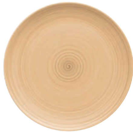
820301 Ceramica Sand

Nicht erhältlich auf Teller flach quadratisch (11 1519, 11 1529) und Platte rechteckig (11 2330) Not available on Plate flat square (11 1519, 11 1529) and Platter rectangular (11 2330)