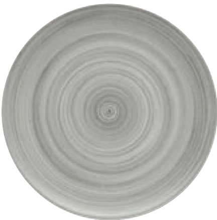
820299 Ceramica Gray