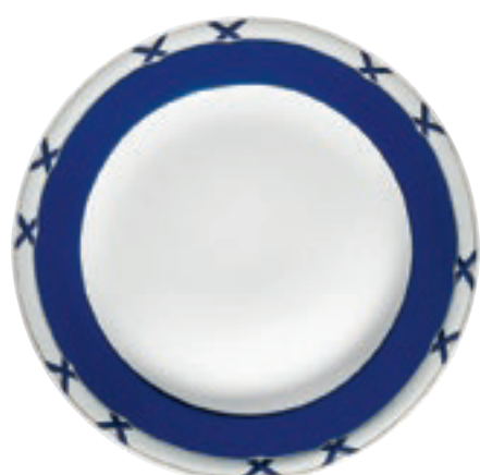
413820 Charlottenburg Blau-Gold – Farbige Kreuze mit Fond Nur auf Tellern und Platten / Only on plates and platter