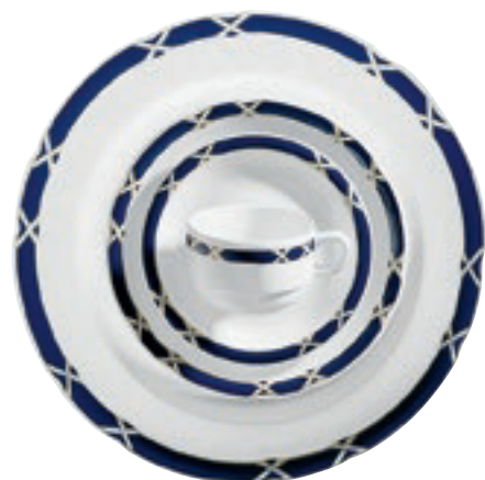
413810 Charlottenburg Blau-Gold – Farbiges Band