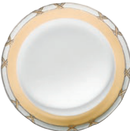
413730 Charlottenburg Gelb-Gold – Farbige Kreuze mit Fond Nur auf Tellern und Platten / Only on plates and platter