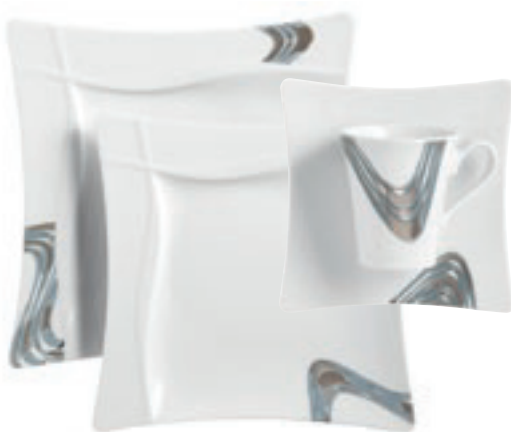
424810 Blue River