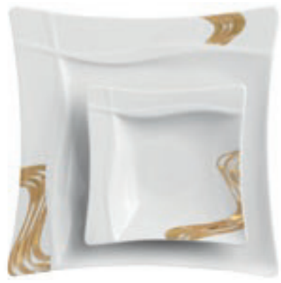
425035 Golden River