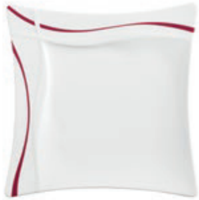
328080 Red Wave