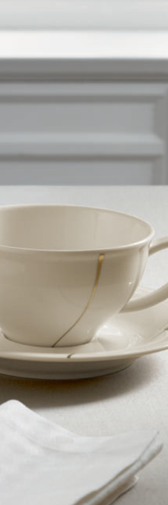
Dekor / Décor Doré (326750)