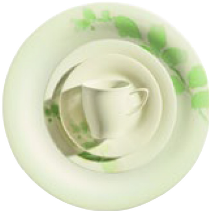
418480 Fleury Grün

Hohlteile undekoriert, Hollowware undecorated, Articles creux sans décor, Piezas complementarias sin decorar, Articoli cavi senza decoro