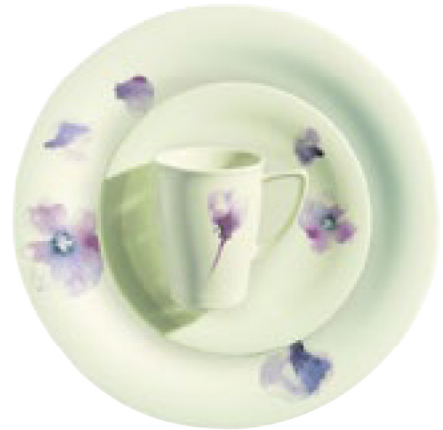
418450 Fleury Violett

Hohlteile undekoriert, Hollowware undecorated, Articles creux sans décor, Piezas complementarias sin decorar, Articoli cavi senza decoro