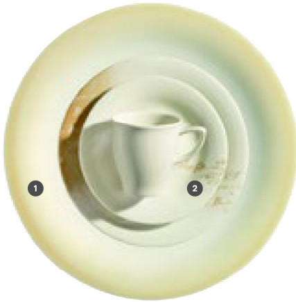
1 418460 Bellevue 2 418440 Poème

Hohlteile undekoriert, Hollowware undecorated, Articles creux sans décor, Piezas complementarias sin decorar, Articoli cavi senza decoro