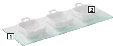
3 MINI CARREES BASSES SUR PLATEAU VERRE 3 MINI SHALLOW SQUARE DISHES ON GLASS TRAY

RECTANGULAR WOODEN BOARD 1 - CODE CDE: 645188 - PAGE 150 2 - CODE CDE: 642111 - PAGE 61 3 - CODE CDE: 644090 - PAGE 62