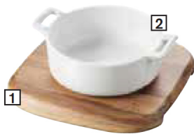
PLATEAU CARRE BOIS SQUARE WOODEN BOARD

1 - CODE CDE: 645182 - PAGE 150 2 - CODE CDE: 618412 - PAGE 63