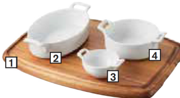
PLATEAU RECTANGULAIRE L 37 CM RECTANGULAR WOODEN BOARD

RECTANGULAR WOODEN BOARD 1 - CODE CDE: 645184 - PAGE 150 2 - CODE CDE: 642087 - PAGE 63