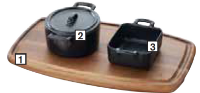
PLATEAU RECTANGULAIRE L 40 CM

1 - CODE CDE: 645186 - PAGE 150 2 - CODE CDE: 638205 - PAGE 63 3 - CODE CDE: 636915 - PAGE 61 4 - CODE CDE: 618412 - PAGE 63