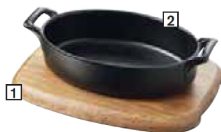
PLATEAU RECTANGULAIRE BOIS

1 - CODE CDE: 645182 - PAGE 150 2 - CODE CDE: 618412 - PAGE 63