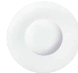
Gourmetteller gourmet plate 30 cm Art.Nr. 87 3414