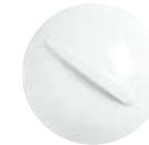
Cloche für Gourmetteller cloche for gourmet plate 16 cm Art.Nr. 87 7636