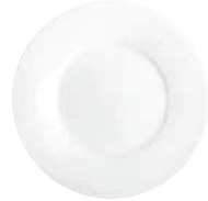
Dessertteller dessert plate 22 cm Art.Nr. 55 3404