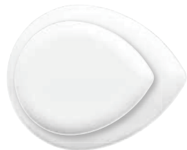
Platte midi platter medium 24 cm Art.Nr. 55 3361