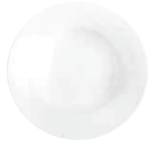
Suppenteller soup plate 24 cm Art.Nr. 55 3416