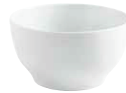
Schüssel bowl 19 cm, 1,70 l Art.Nr. 55 2902