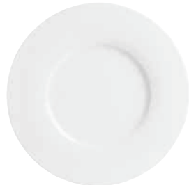
Platzteller show plate 31 cm Art.Nr. 55 3432