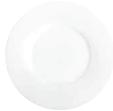
Esteller dinner plate 27 cm Art.Nr. 55 3429