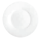
Brotteller bread plate 17 cm Art.Nr. 55 3400