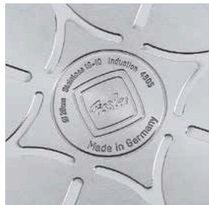
Der perfekt aufliegende cookstar Allherdboden erwärmt den Topf schnell, gleichmäßig und energiesparend, ganz gleich ob er auf einem Gas-, Elektro-, Ceran- oder Induktionsherd zum Einsatz kommt.