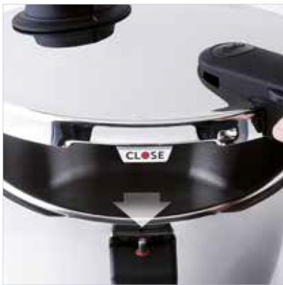
Aufsetzhilfe: Zum einfachen Aufsetzen des Deckels.

Die einfache Handhabung und die durchdachten Funktionen des vitavit® comfort sorgen dafür, dass Sie keinen Tag auf Ihren neuen Schnellkochtopf verzichten möchten. Mit der Schongarstufe für empfindliche Speisen, wie z. B. feines Gemüse oder Fisch, und der Schnellgarstufe für Suppen, Fleisch oder Eintöpfe lassen sich nahezu alle Gerichte schnell, gesund und lecker zubereiten.