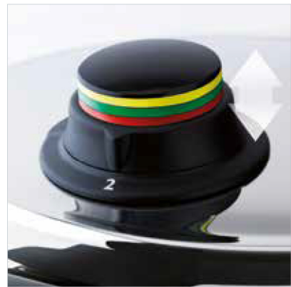
Kochanzeige mit Ampelfunktion: Hilft, den Kochprozess einfach zu steuern.