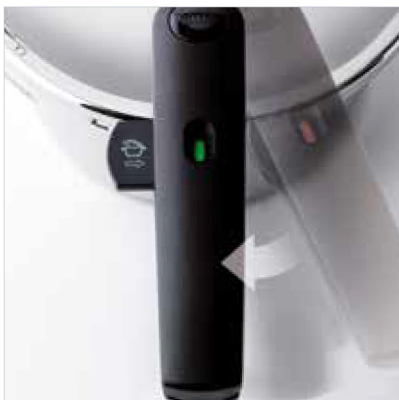
Verriegelungsanzeige: Zeigt optisch und akustisch, ob der Topf sicher verschlossen ist.