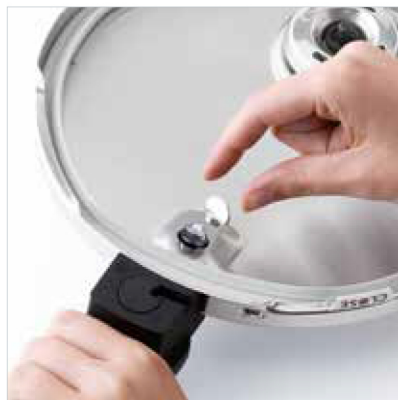
Abnehmbarer Griff: Für eine einfache Reinigung.