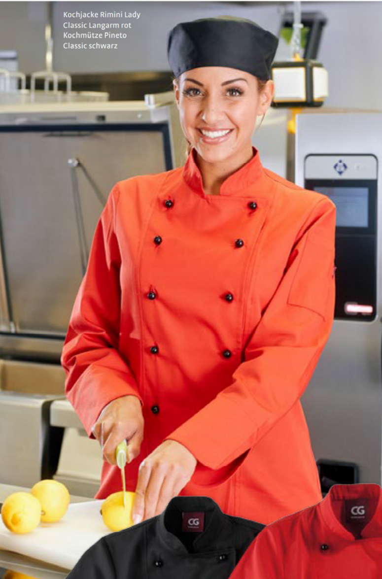
Kochjacke Rimini Lady Classic Langarm rot Kochmütze Pineto Classic schwarz