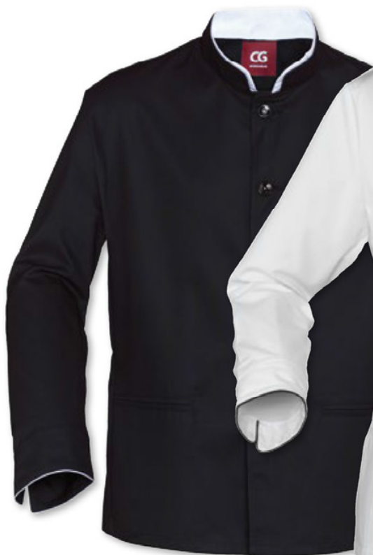
schwarz - weiß