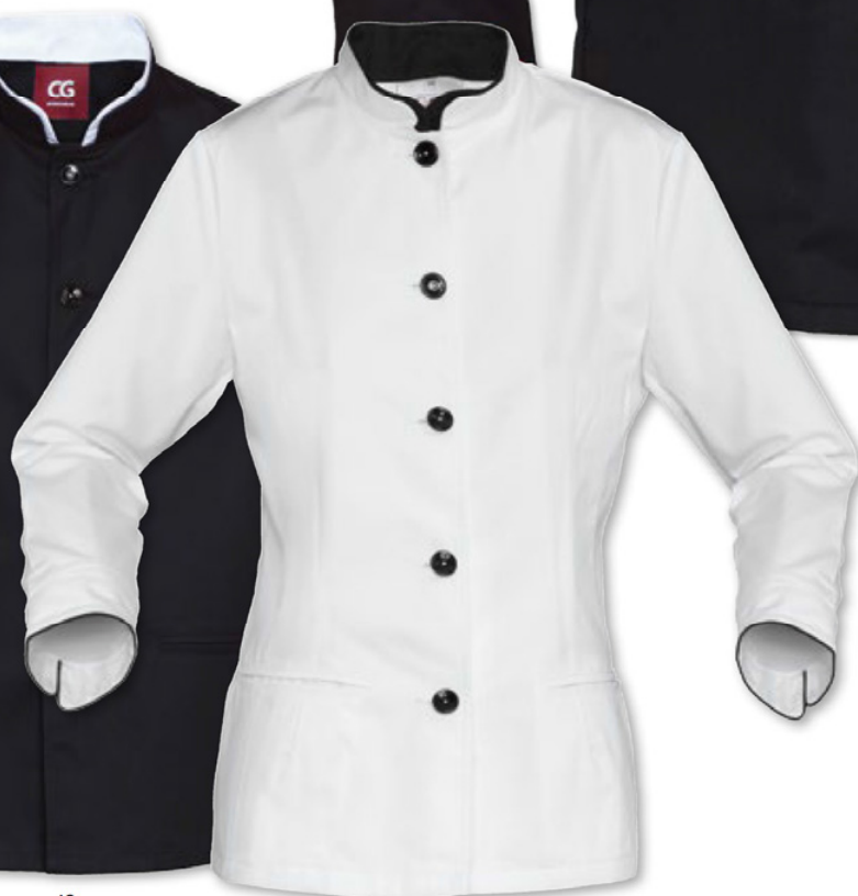
weiß - schwarz