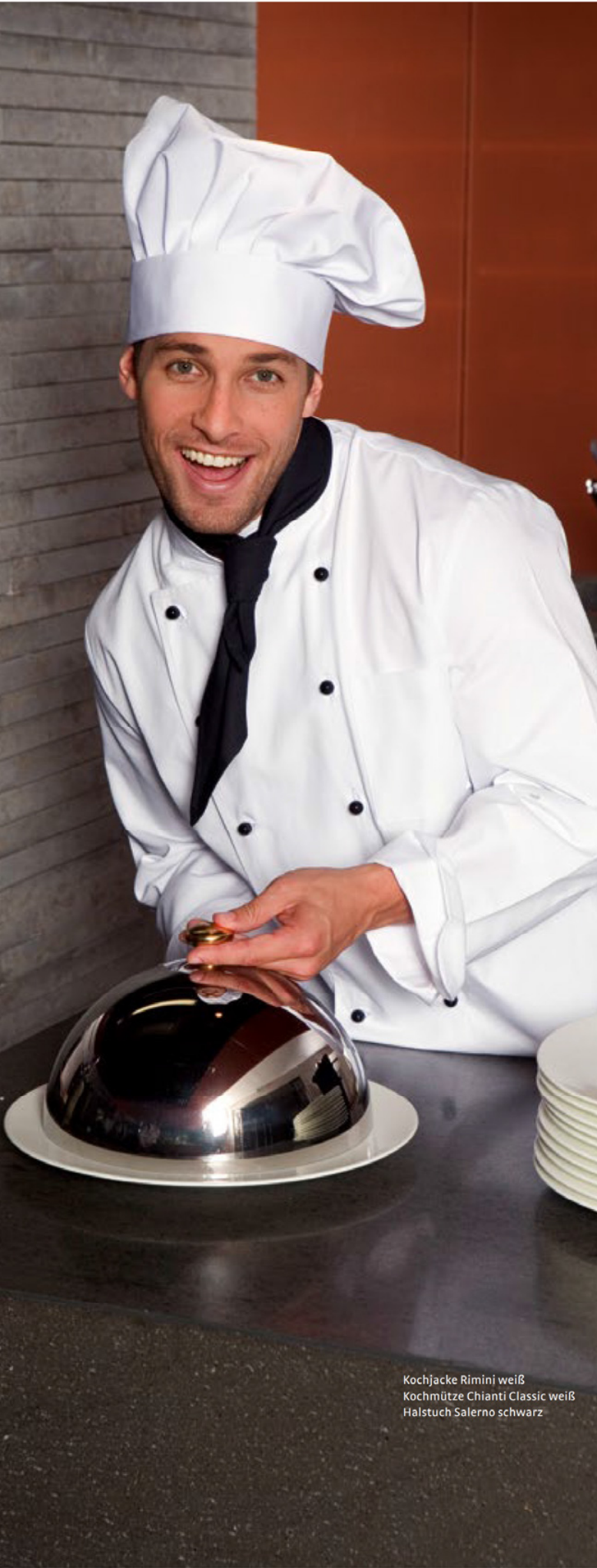
Kochjacke Rimini weiß Kochmütze Chianti Classic weiß Halstuch Salerno schwarz