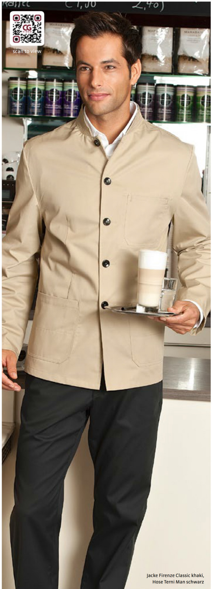
Jacke Firenze Classic khaki, Hose Terni Man schwarz