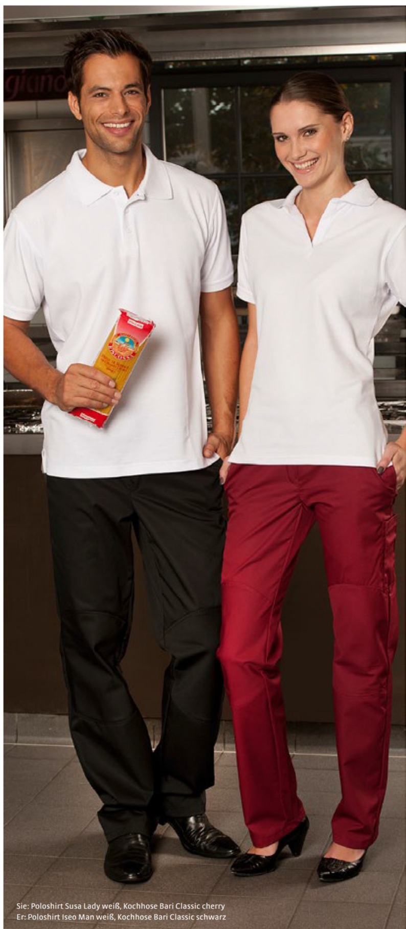
Sie: Poloshirt Susa Lady weiß, Kochhose Bari Classic cherry Er: Poloshirt Iseo Man weiß, Kochhose Bari Classic schwarz