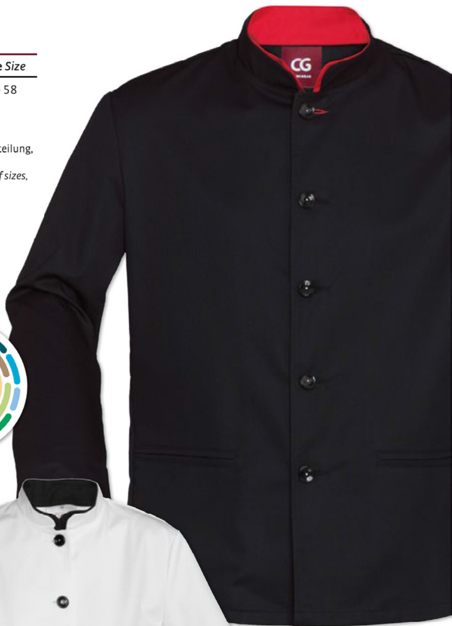
schwarz - rot