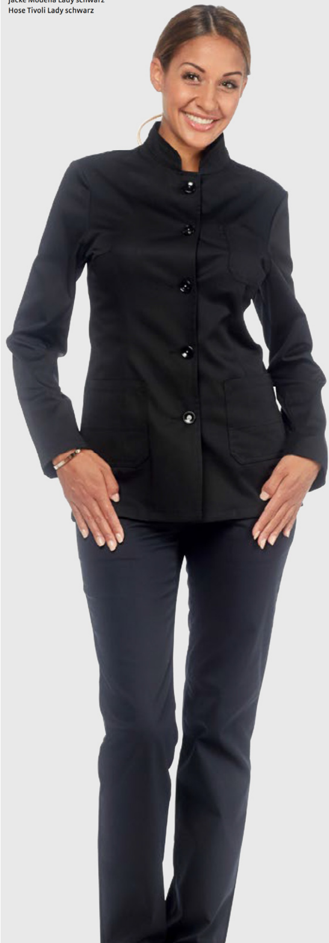
Jacke Modena Lady schwarz Hose Tivoli Lady schwarz