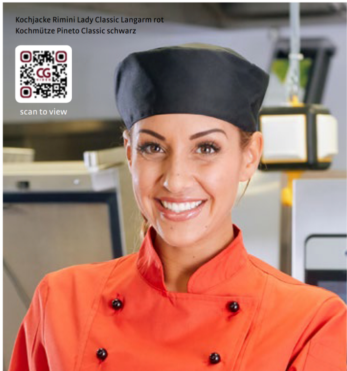
Kochjacke Rimini Lady Classic Langarm rot Kochmütze Pineto Classic schwarz