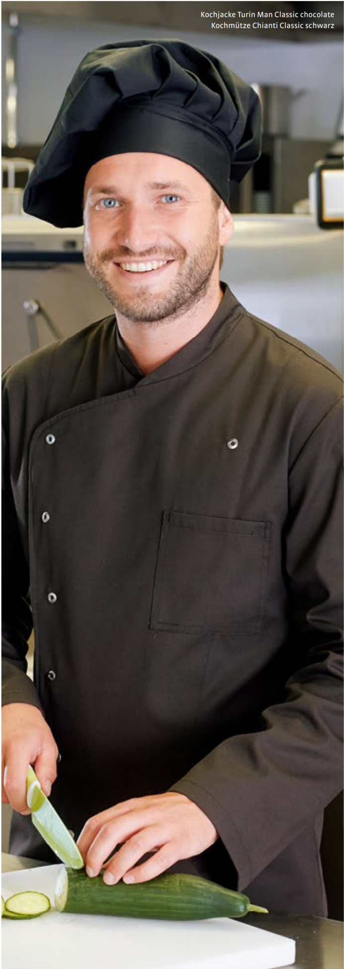
Kochjacke Turin Man Classic chocolate Kochmütze Chianti Classic schwarz

Alle Farben 95° C waschbar All colours 95° C washable Strapazierfähig Hard-wearing Made in Germany Made in Germany